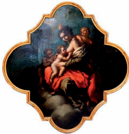
Dipinto ad olio raffigurante Madonna con Bambino e S. Giovanni - F. Giordano - sec.XVII- XVIII (Proprietà Cassa Forense)

La domanda deve essere presentata, a pena di decadenza, a decorrere dal compimento del sesto mese di gravidanza (26esima settimana di gestazione) fino al termine perentorio di 180 giorni dal parto.